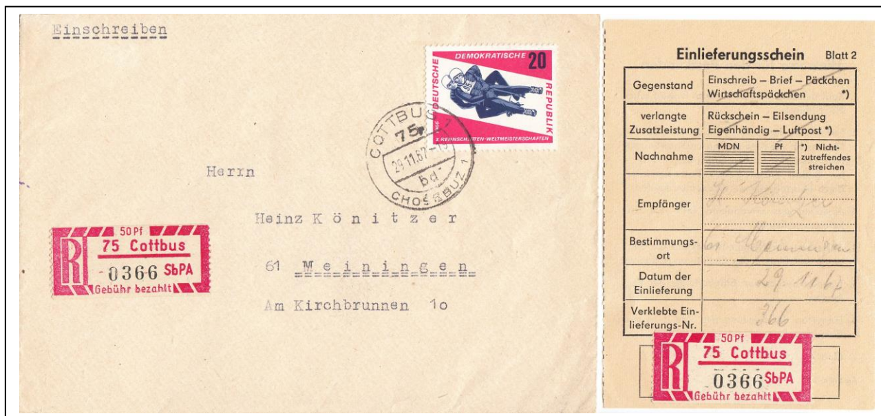
Abb 1: Bx 75 Cottbus, KN 0366 (geglättetes Papier), v. 29.11.67, Els 2: .../67/2581 15 967...

Anhand der beiden Belege mit Els (Abb. 1 und Abb. 2), die jeweils mit einer geglätteten Einschreibemarke Bx (Zählung 12½) der offiziellen Versuchsausgabe von 75 Cottbus, Kontrollnummer 0366 auf Brief und Einlieferungsschein, versehen ist, dürfte es bewiesen sein, daß es mindestens zwei 500er Rollen mit geglättetem Papier gegeben hat. Rollenunterschiede konnten von hier nicht festgestellt werden.