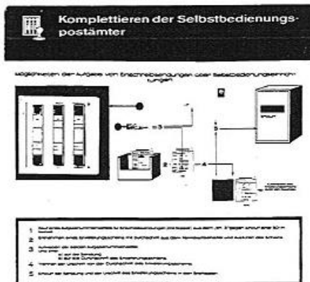
Darstellung des Arbeitsablaufs bei der Einlieferung von Einschreibbriefen über eine Selbstbedienungseinrichtung, Ausstellungstafel von der Arbeitstagung des Ministeriums für Post- und Fernmeldewesen in Seebad Ahlbeck im Oktober 1966.

Der besondere Einschreibnummernzettel (Selbstbedienung) entsprach in seinem grundsätzlichen Aufbau dem Muster, wie es vom Weltpostverein vorgegeben war und in allen Mitgliedsländern angewendet wurde. Sie