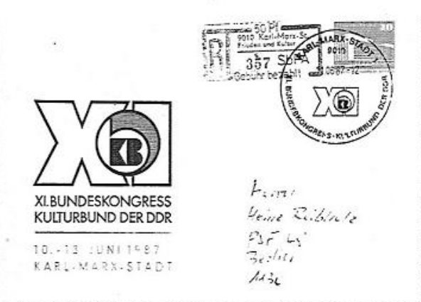
Selbstbedienungs-Einschreibnummernzettel aus Karl-Marx-Stadt aus der Endperiode.

geworden, dass die eingesetzte Technik einen sehr hohen Aufwand erforderte und ein Nutzen durch Arbeitszeiterparungen nicht eingetreten war, sich die Arbeitskräftesituation auch nicht in dem Maße verschlechtert hatte, wie man das anfangs noch erwarten musste, und sich schließlich eine Vereinfachung der Schaltertätigkeiten durch den Einsatz elektronischer Technik (u. a. Schalterterminals) abzeichnete. Der sehr langsame Abbau der Selbstbedienung hatte im Wesentlichen zwei Gründe: Einerseits wurden die Einschreibnummernzettel (Selbstbedienung) zu einem großen Teil durch Sammler gekauft (die Post hatte lange versucht, das zu verhindern, es ist aber durch die Sammler erzwungen worden) und waren dadurch auch zu einem Devisenbringer geworden. Wer wollte es schon verantworten, diese Quelle plötzlich versiegen zu lassen? Eine solche Entscheidung lag auch nicht allein im Ermessen der Post. Andererseits zeichneten sich mit dem Einsatz elektronischer Technik im Bereich des Annahmedienstes auch völlig neue Lösungswege für die Selbstbedienung – die auch schon um die Mitte der 1980er-Jahre in einigen Teilen konzipiert waren – ab, und es schien eher angeraten, die weniger geeigneten Verfahren und die primitive Technik zu ersetzen als ein an sich zukunftsweisendes Verfahren in einem