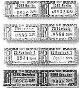
Einschreibnummernzettel Selbstbedienung der ersten Versuchsstrie, bei denen beide Teile noch identisch waren.