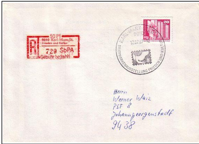
Abb. 10.4 Umschläge und Karten mit Ausstellungsstempel