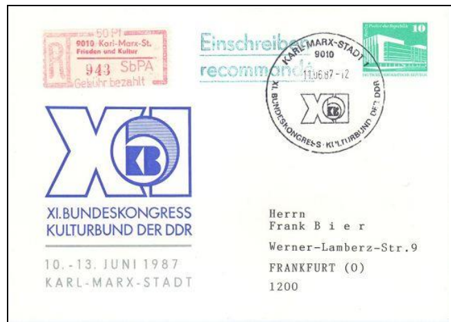
Abb. 10.2 Postkarte „XI. Bundeskongress“