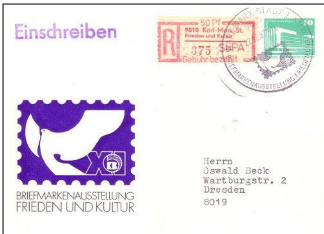
Abb. 10.1 Ausstellungspostkarte „Frieden und Kultur“

1) Diese Auflage stammt aus dem Export und war zur Zeit der Ausstellung nur als Bänderolenverschußmarke bekannt geworden. Eine Verwendung auf Belegen dürfte deshalb erst nach Abschluß der Briefausstellung möglich gewesen sein.