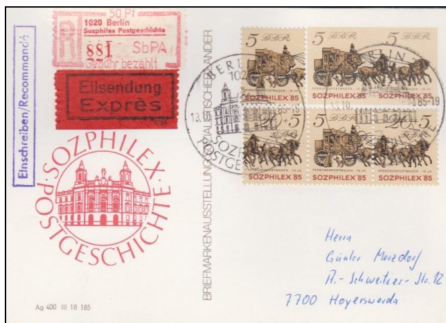
Abb. 6.5 Vorderseite; RS: „Postmeilensäulen“ (P 93e)