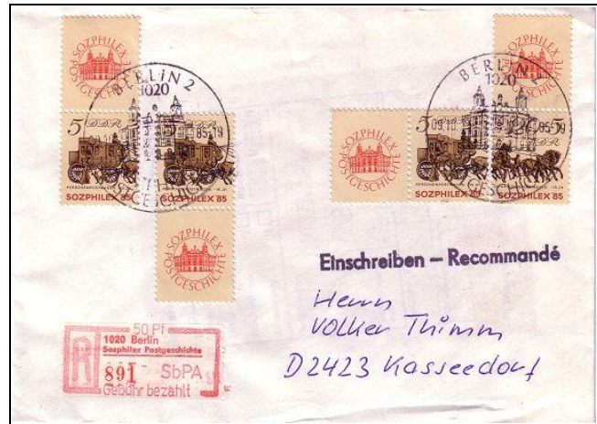
Abb. 6.9 Umschläge und Karten mit Ausstellungssonderstempel