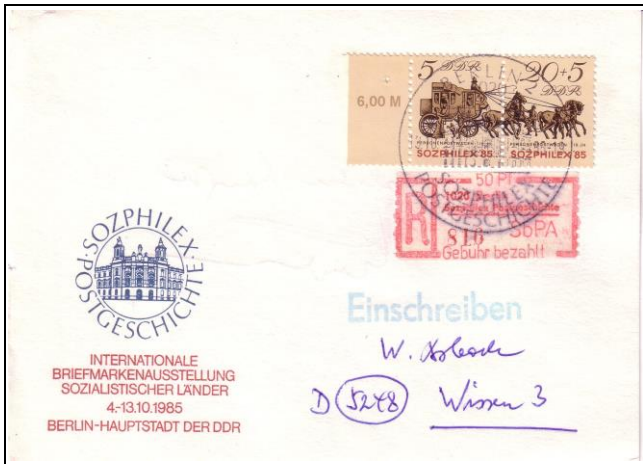
Abb. 6.8 Ausstellungskarte „SOZPHILEX POSTGESCHICHTE“ (Emblem blau, Schrift rot)