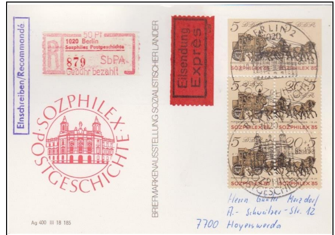
Abb. 6.4 Vorderseite; RS: „Postillione“ (P 93d)