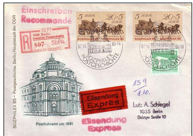
Abb. 6.6 Ersttagsbriefumschlag für die Sondermarken „SOZPHILEX '85“ (Mi. 2965/66)