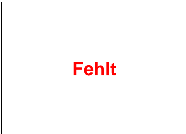
Abb. 6.10 Umschläge und Karten mit Tagesstempel 1020 Berlin 2