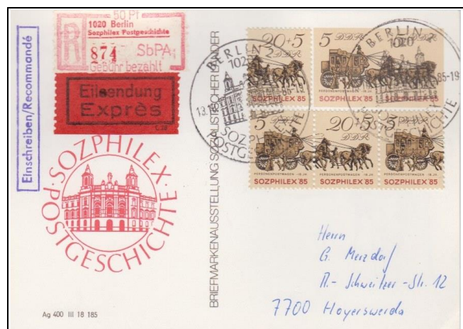
Abb. 6.2 Vorderseite; RS: „Französischer Landbriefträger“ (P 93b)