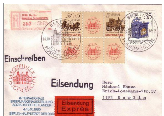
Abb. 6.7 Ausstellungsumschlag „SOZPHILEX POSTGESCHICHTE“ (Emblem rot, Schrift blau)