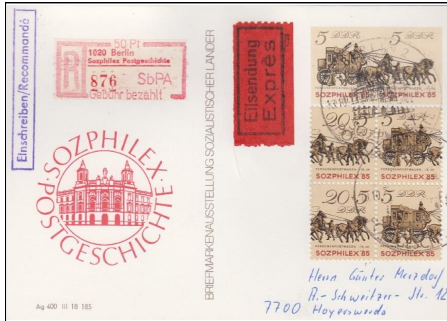
Abb. 6.3 Vorderseite; RS: „Posthausschilder“ (P 93c)