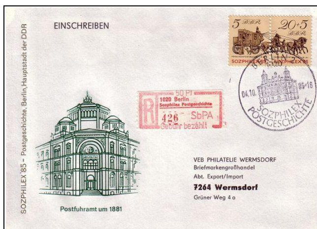
Abb. 6.6 Ersttagsbriefumschlag für die Sondermarken „SOZPHILEX '85“ (Mi. 2965/66)