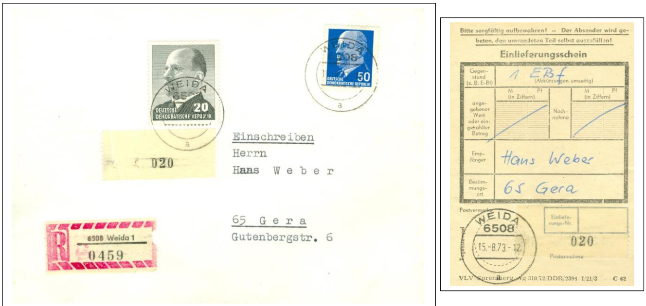
Abb.: 1 Portogerechter R-Brief und Einlieferungsschein mit dem Teststreifen T3 (1), KN 020, Tagesstempel PA 6508 Weida, vom 15.8.73

(Eine Ergänzung zu dem Bericht „Banderolenverschlußstreifen“, vom 26./27.05.16)