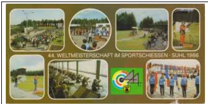
44. WELTMEISTERSCHAFT IM SPORTSCHIESSEN - SUHL 1986