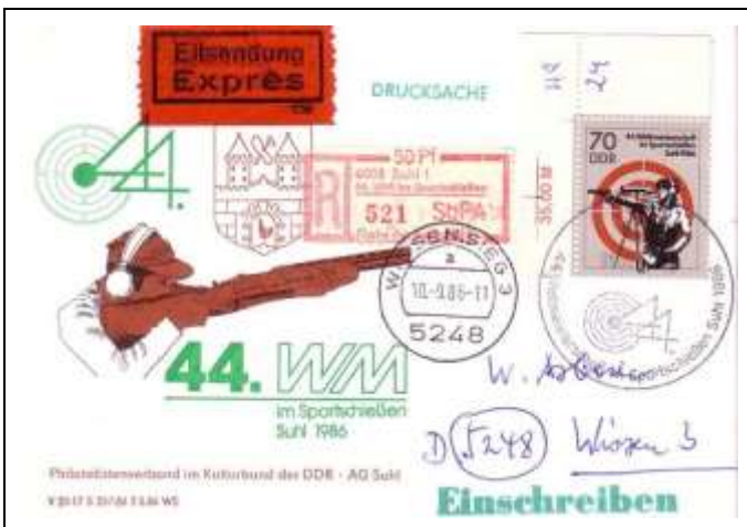
Abb. 8.5 Ausstellungskarte „44. Weltmeisterschaft im Sportschießen 1986“