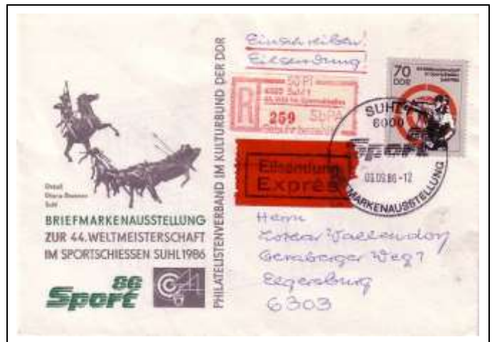
Abb. 8.3 Ausstellungsumschlag „Sport 86“