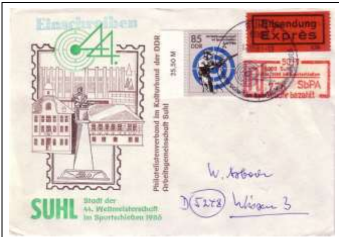
Abb. 8.4 Ausstellungsumschlag „Suhl, Stadt der 44. Weltmeisterschaft im Sportschießen 1986“, Stempel 2