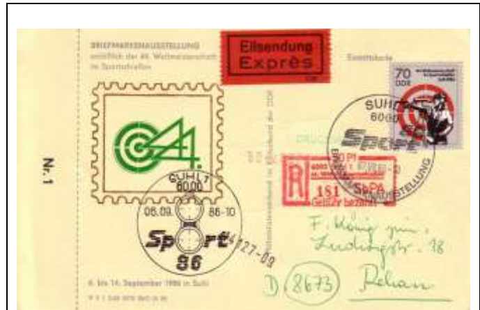
Abb. 8.7a Eintrittskarte „Sport 86“