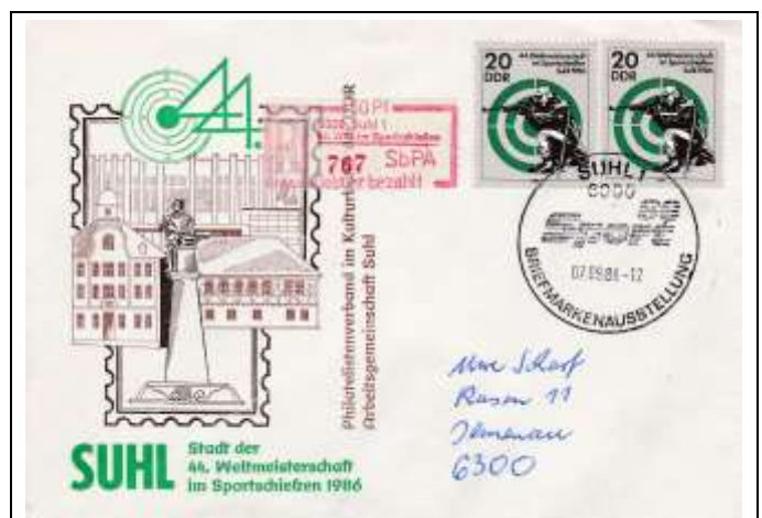
Abb. 8.4 Ausstellungsumschlag „Suhl, Stadt der 44. Weltmeisterschaft im Sportschießen 1986“, Stempel I