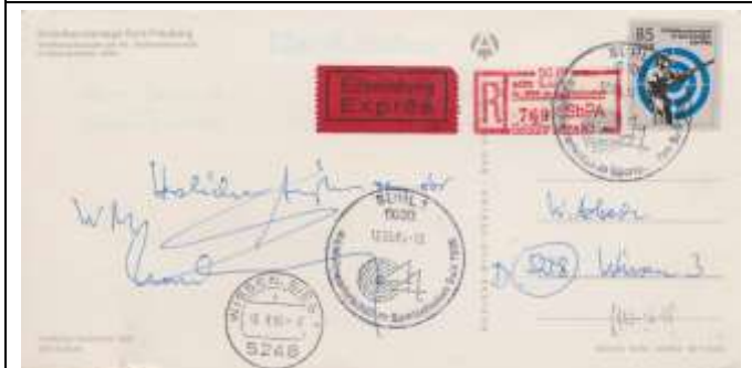
Abb. 8.8 Umschläge und Karten mit Ausstellungsstempel, Vorder- und Rückseite, Stempel 2