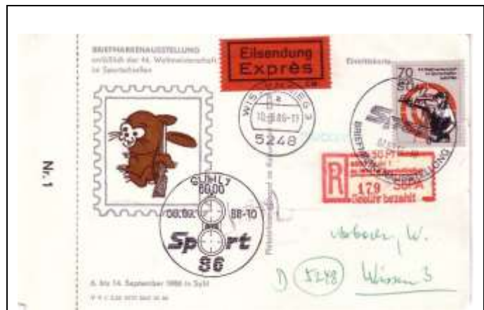
Abb. 8.7b Eintrittskarte „Sport 86“