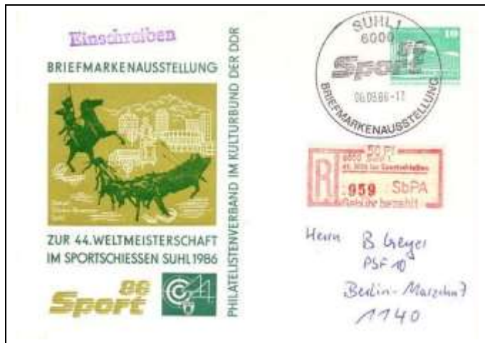
Abb. 8.1 Ausstellungspostkarte „Sport 86“

2) Alle Preise gem. Wermisdorf-Aufstellung Knüppel (-.- Auflage liegt nicht vor.)