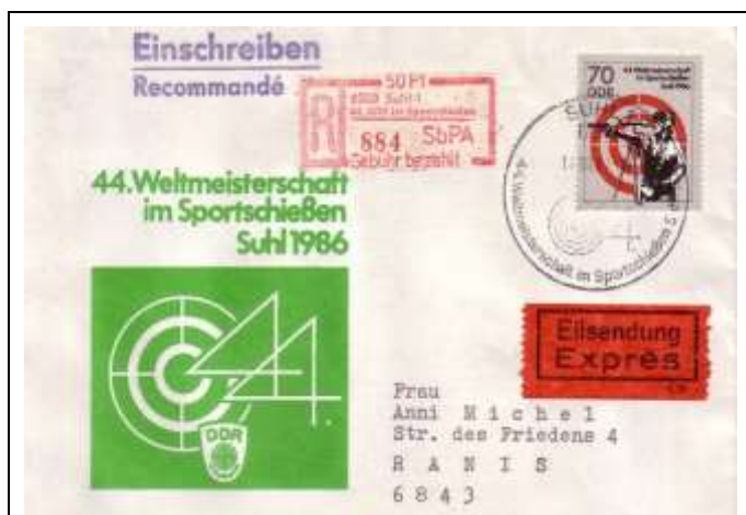
Abb. 8.2 Ersttagsbriefumschlag für die Sondermarken „44. Weltmeisterschaft im Sportschießen 1986“ (Mi. 3045/47)