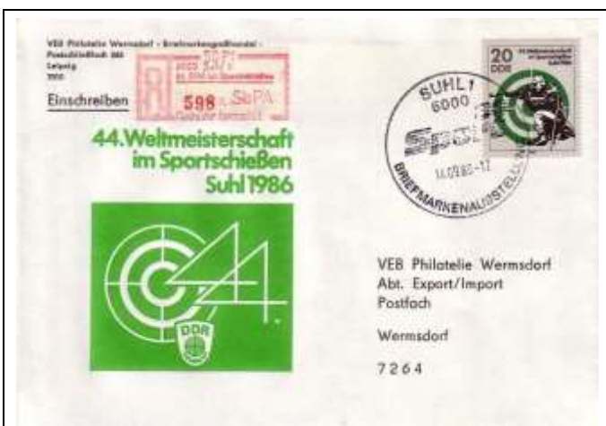
Abb. 8.6 Ersttagsbriefumschlag VEB Wermisdorf