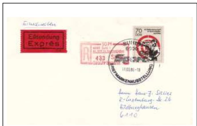
Abb. 8.8 Umschläge und Karten mit Ausstellungssonderstempel, Stempel 1