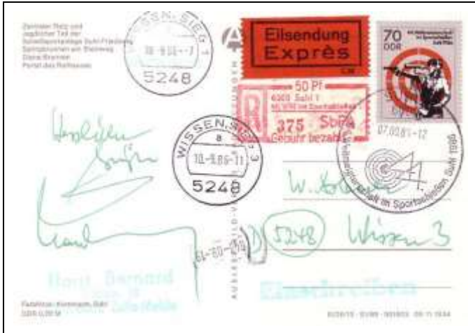
Abb. 8.8 Umschläge und Karten mit Ausstellungsstempel, Stempel 2