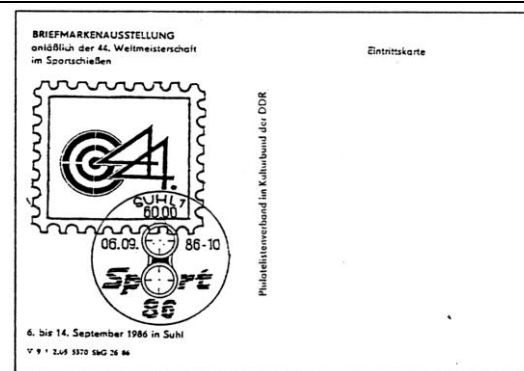
Abb. 8.6 Eintrittskarte „Sport 86“