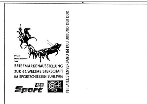
Abb. 8.3 Ausstellungsumschlag „Sport 86“