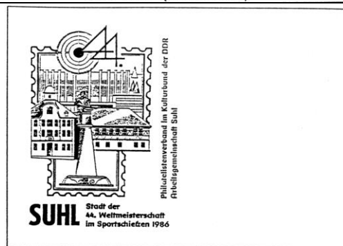
Abb. 8.4 Ausstellungsumschlag „Suhl, Stadt der 44. Weltmeisterschaft im Sportschießen 1986“