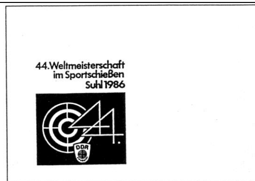
Abb. 8.2 Ersttagsbriefumschlag für die Sondermarken „44. Weltmeisterschaft im Sportschießen Suhl 1986“ (Mi. 3045/47)