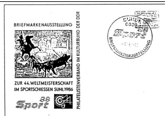
Abb. 8.1 Ausstellungspostkarte „Sport 86“