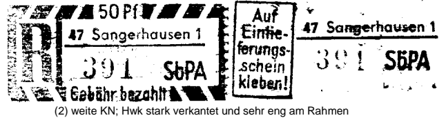
(2) weite KN; Hwk stark verkantet und sehr eng am Rahmen