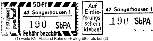
(1) weite KN; Abstand Rahmen-Hwk größer als bei (2)