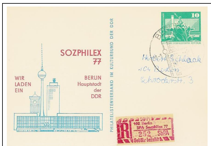
Abb. 1.4 Einladungspostkarte „Wir laden ein“; ohne und mit gedruckter Anschrift (Mi. PP 15/83a u. b).