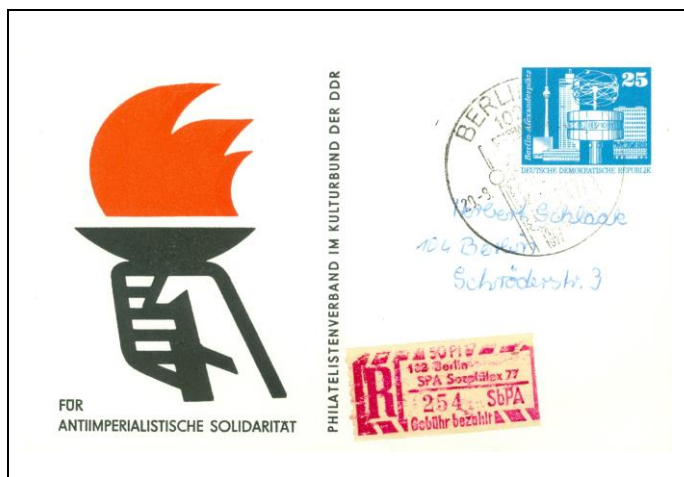
Abb. 1.3 Ausstellungspostkarte „Solidarität“ (Stempel 2), ohne Zudruck