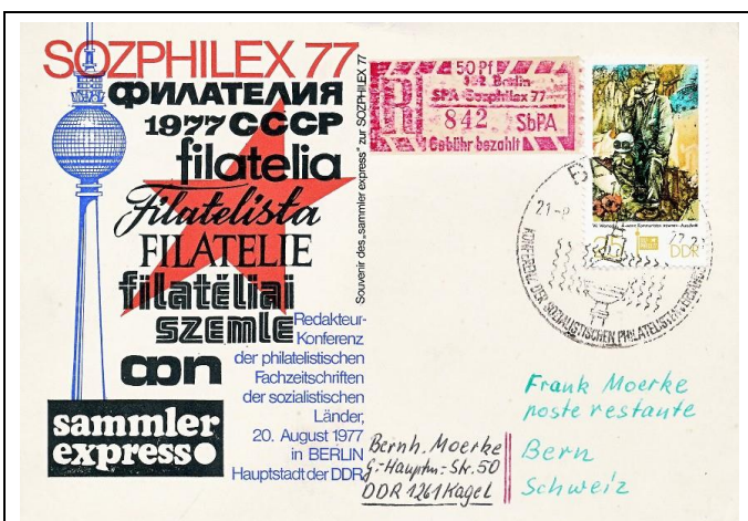
Abb. 1.9 Souvenirkarte des „sammler express“