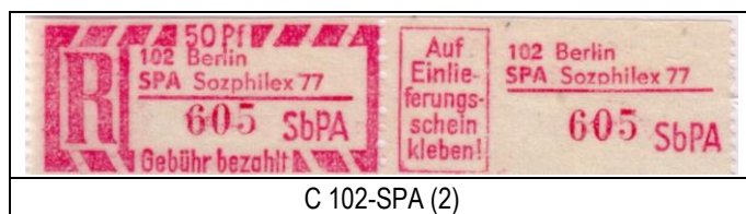
C 102-SPA (2)