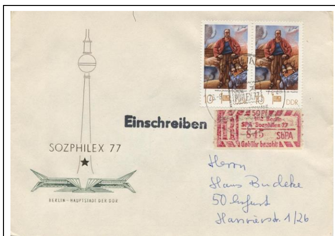
Abb. 1.7a Ersttagsbriefumschlag für die Sondermarken: „SOZPHILEX 77“ (Mi. 2247/49), ohne Zudruck (Stempel 1)