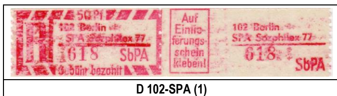
D 102-SPA (1)