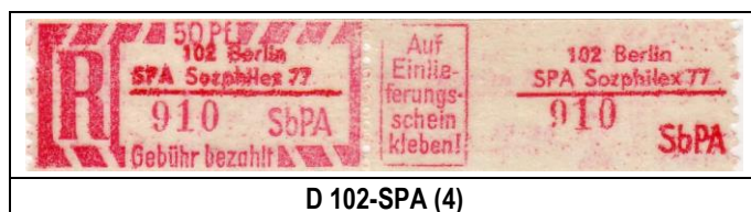
D 102-SPA (4)