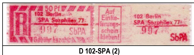
D 102-SPA (2)