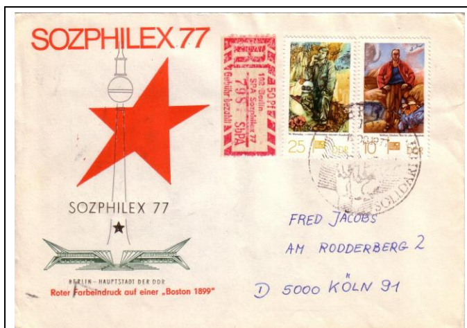
Abb. 1.7b Ersttagsbriefumschlag für die Sondermarken „SOZPHILEX 77“ (Mi. 2247/49), mit Zudruck: Roter Farbeindruck auf einer „Boston 1899“