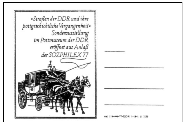
Abb. 1.10 Souvenirkarte zur Sonderpostausstellung im Postmuseum.