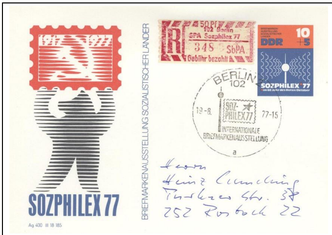
Abb. 1.1 Sonderpostkarte „SOZPHILEX“ (Stempel 1)