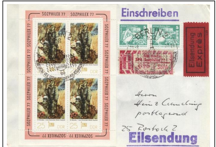
Abb.1.12 Umschlag mit Ausstellungssonderstempel (3)