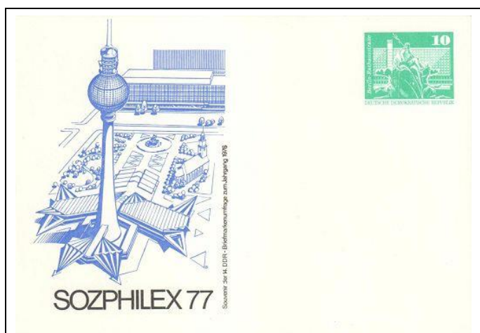
Abb. 1.5 Souvenirpostkarte der 14. DDR-Briefmarkenumfrage zum Jahrgang 1976; ohne DV: ohne gedr. Anschrift (Mi. PP 15/84a); mit gedr. Anschrift (Mi. PP 15/84b...d); mit DV III 18 185 Ag 400: ohne gedr. Anschrift (Mi. PP 15/85a...b); mit gedr. Anschrift (Mi. PP 15/85c)