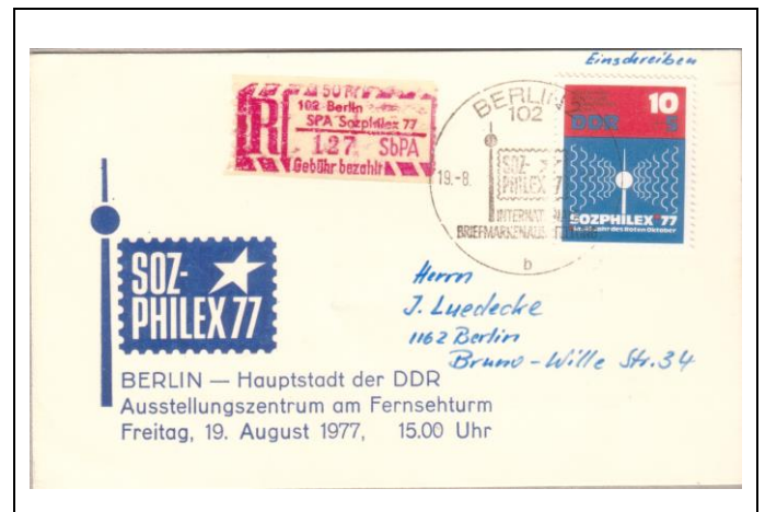
Abb. 1.11 Einladungskarte, rückseitig mit: „Zur Eröffnung der Briefmarkenausstellung sozialistischer Länder SOZPHILEX...“