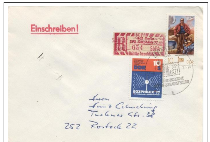
Abb. 1.12 Umschlag mit Ausstellungssonderstempel (1), Kennbuchstaben „a“