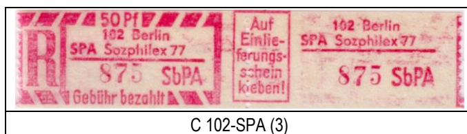
C 102-SPA (3)