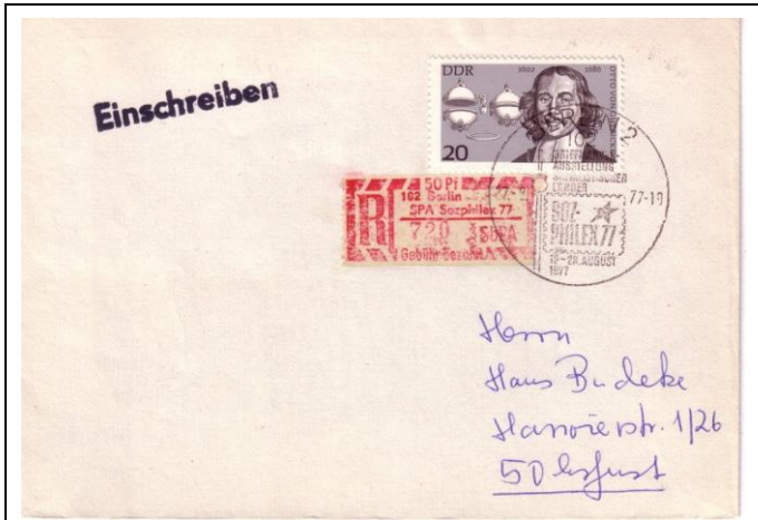
Abb.1.12 Umschlag mit Ausstellungssonderstempel (2)