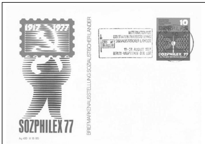
Abb.1.12 Maschinenwerdestempel (6).