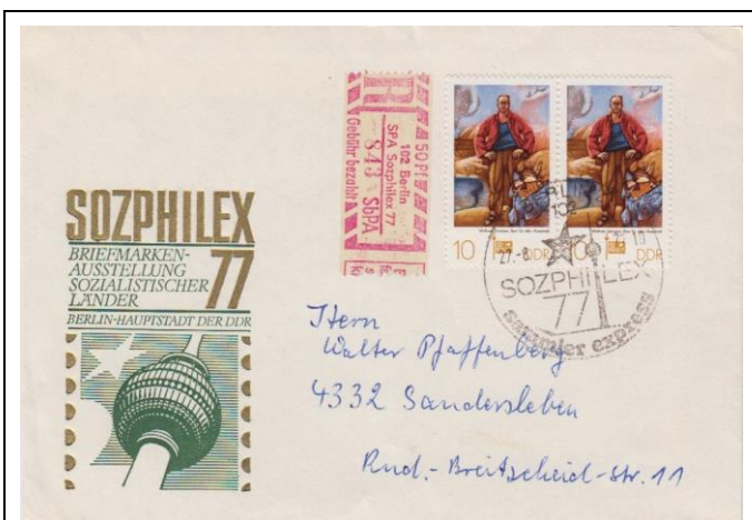
Abb. 1.8 Ausstellungsumschlag (Stempel 4)