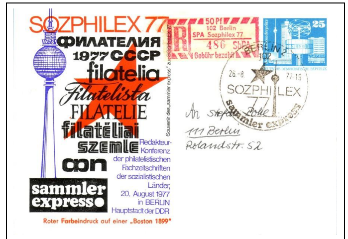
Abb. 1.2b Ausstellungspostkarte „sammler express“ mit Zudruck: Roter Farbeindruck auf einer „Boston 1899“ (Die Druckmaschine „Boston 1899“ stand zu Demonstrationszwecken im Schalterraum. Die am Schalter gekauften Ganzsachen wurden auf Kundenwunsch mit dem roten Zudruck versehen.)