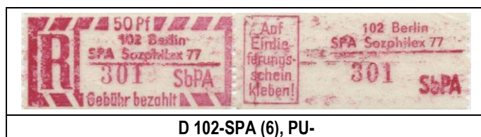
D 102-SPA (6), PU-