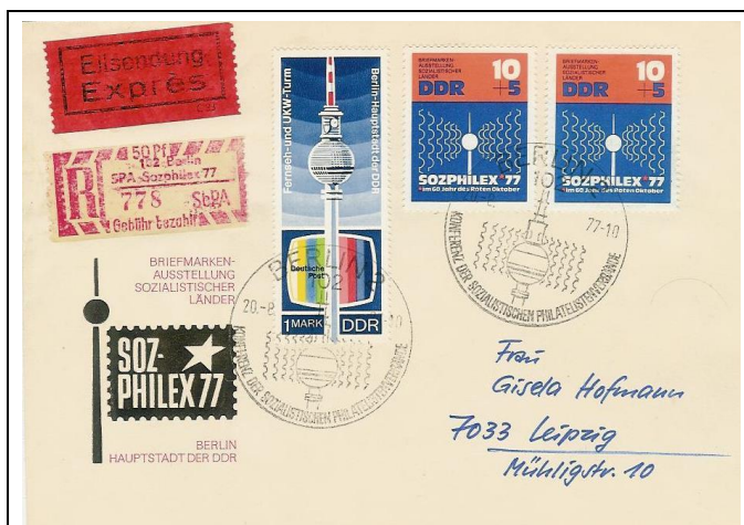
Abb. 1.6 Ersttagsbriefumschlag für die Sondermarke „SOZPHILEX 77“ (Mi. 2170).