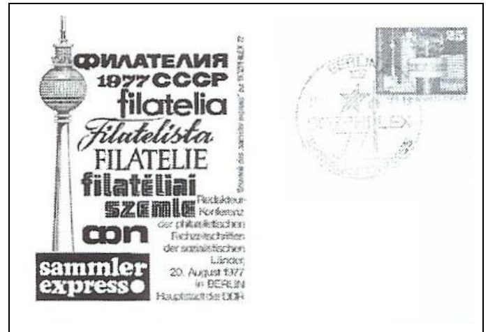
Abb. 1.2c Ausstellungspostkarte „sammler express“, ohne Zudruck und Stern.