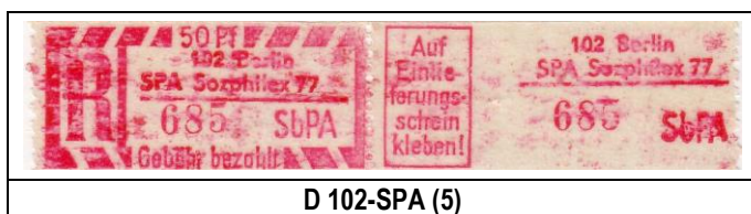
D 102-SPA (5)