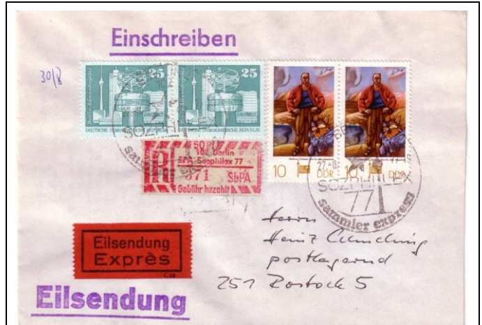
Abb.1.12 Umschlag mit Ausstellungssonderstempel (4)