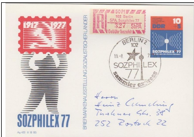
Abb. 1.1 Sonderpostkarte „SOZPHILEX“ (Stempel 4)