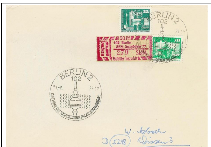
Abb.1.12 Umschlag mit Ausstellungssonderstempel (3)