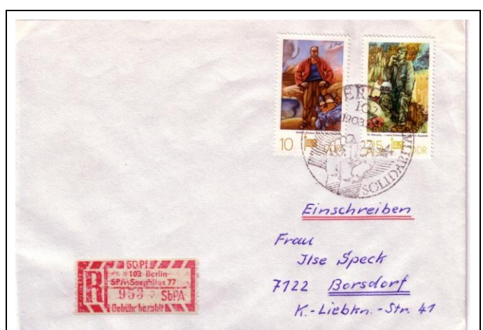
Abb.1.12 Umschlag mit Ausstellungssonderstempel (5)