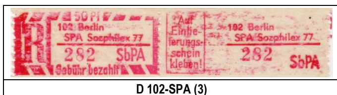
D 102-SPA (3)