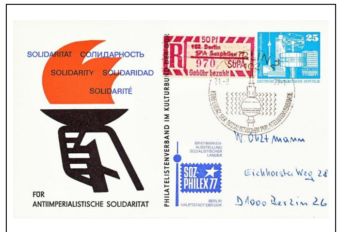
Abb. 1.3 Ausstellungspostkarte „Solidarität“ (Stempel 3)