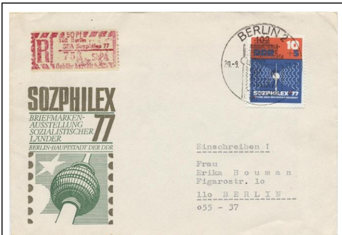
Abb. 1.8 Ausstellungsumschlag (Stempel 2)