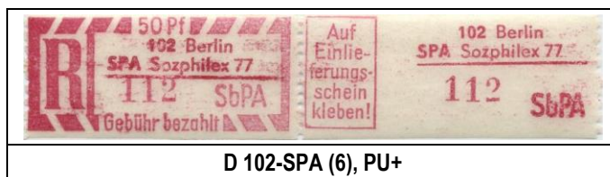
D 102-SPA (6), PU+

Bei den Einschreibemarken der Zähnung D war die ursprüngliche Auflage, nach zeitgenössischen Erkenntnissen, die der Papiersorte PU+, welche bereits am 1. Tag (19.08.1977) restlos vergriffen war. Ab 21.08.1977 wurden die Einschreibemarken der Zähnung D in PU- verkauft. Es ist nicht anzunehmen, daß es während der gesamten Zeit der Ausstellung jemand gab, der den Überblick gehabt hätte, welche EM-Auflagen insgesamt erschienen waren.