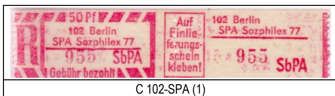
C 102-SPA (1)

Zur Ausstellung verausgabte Sonder-Einschreibemarken: