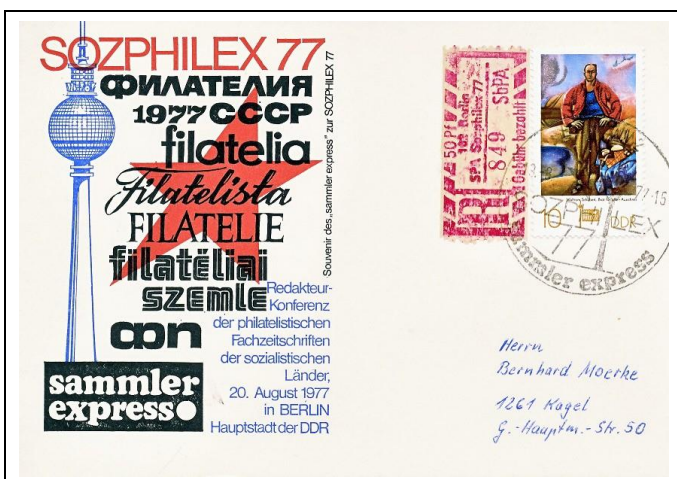
Abb. 1.2a Ausstellungspostkarte „sammler express“