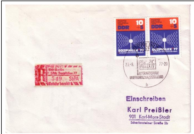
Abb.1.12 Umschlag mit Ausstellungssonderstempel (1), Kennbuchstaben „b“