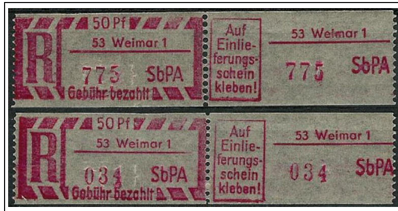
B 60-1 g II, KN gZ 304 / KN kZ 458