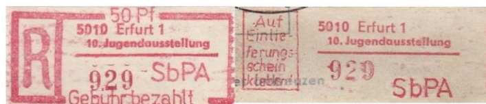
(Bildmontage: DLT vom Brief und QT vom Einlieferungsschein mit KN 929)

Bei dem Zusammenfügen des DLT und des QT kann man deutlich in der Bildmontage erkennen, daß das DLT breiter (20 mm) als das QT (19 mm) ist. Somit stammen das DLT und das QT mit der KN 929 aus zwei verschiedenen Rollen , das QT von der Auflage (6) und nicht von (1).