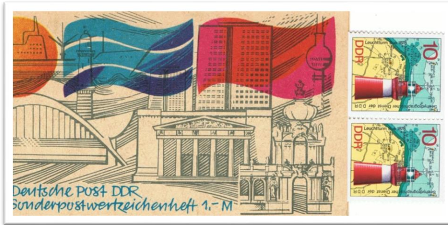
SMHD 5b (P) für Schalterverkauf, ohne Werbung

Sondermarken (gelegentlich auch von 20-Pf-Sondermarken) wurden in Streifen gerissen. Deren Ober- oder Unterränder wurden zum Einkleben in die Papier- oder Pappdeckel benutzt. Für die manuelle Herstellung von Markenheftchen mit variablen Sondermarken wurde ein finanzieller Aufwand von 6,2 Pf pro Stück errechnet.