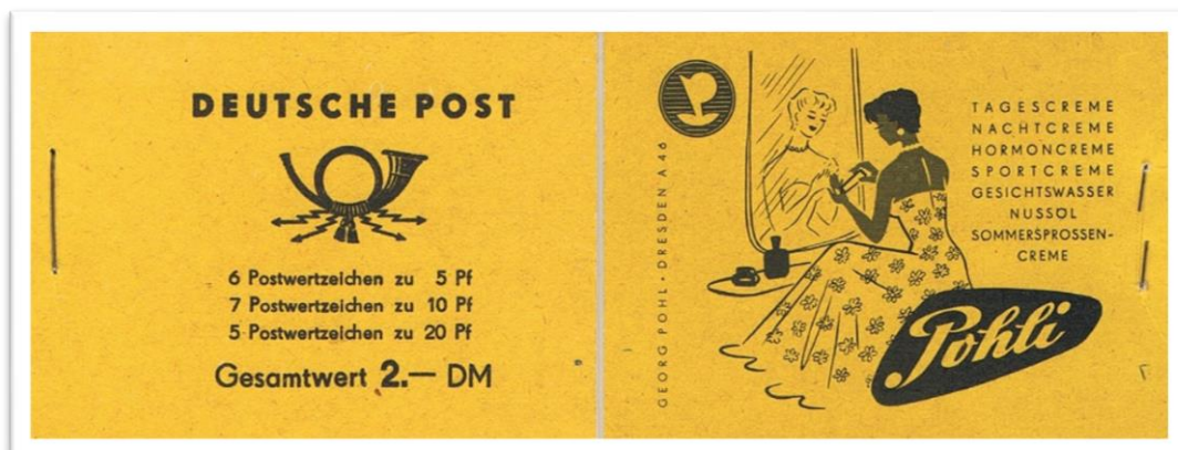
MH 1 a1 – Vorderseite (Inhalt: FM Fünfjahrplan)

Großer Beliebtheit unter den Postkunden und Sammlern erfreuten sich die Postwertzeichenheftchen (umgangssprachlich als Markenheftchen bezeichnet) der Deutschen Post. Sie wurden in der DDR seit 1955 mit und ohne Werbung sowie mit und ohne Zwischenblätter in das Angebot aufgenommen und gern gekauft.