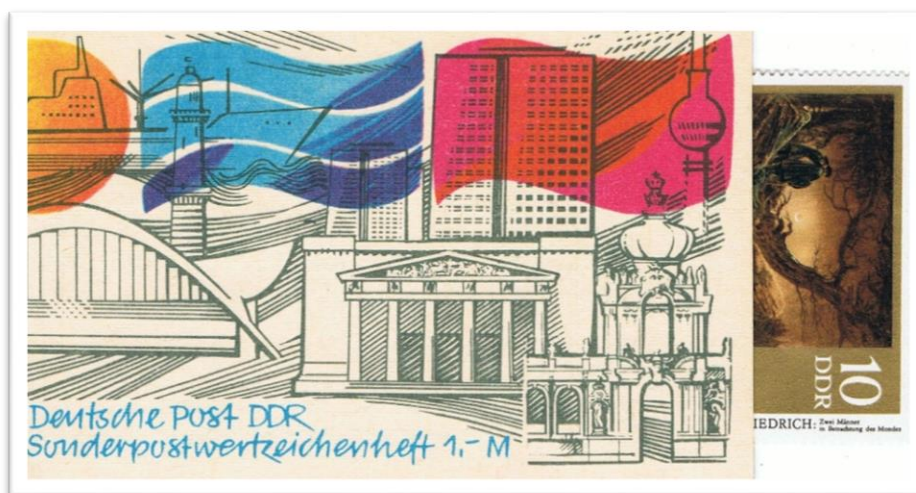
SMHD 5ax (K) für Verkaufsautomaten WH 2m, mit Werbung

Für die gesamte Organisation von Herstellung und Vertrieb der Markenheftchen mit variablen Inhalt (SMHD) gab es in 2352 Prora / Rügen sowohl die erforderlichen Räumlichkeiten als auch geeignetes und arbeitssuchendes Personal für eine Außenstelle . In der