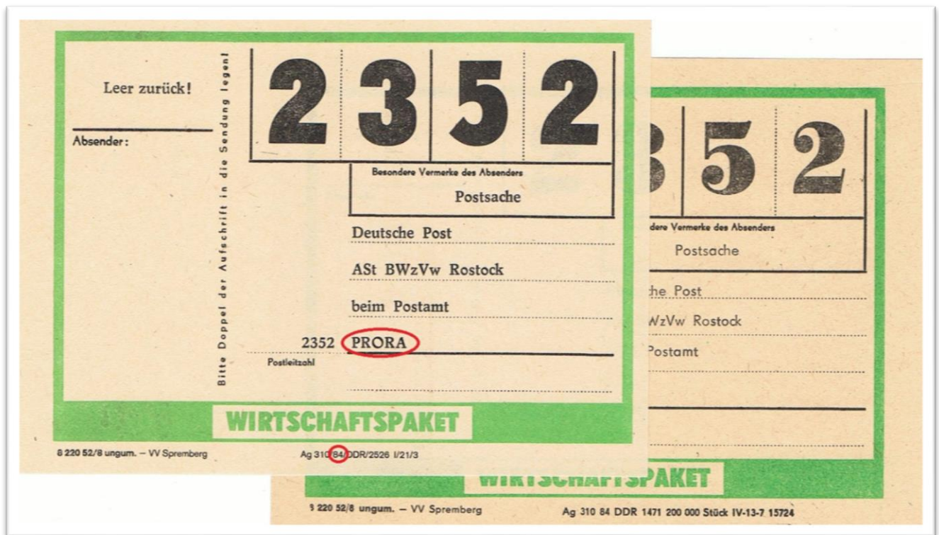
Paketanschriftenzettel für Wirtschaftspakete nach 2352 Prora

Außenstelle (ASt) Prora der Bezirkswertzeichenverwaltung (BWzVw) Rostock fanden zahlreiche Ehefrauen von NVA-Offizieren eine Beschäftigung.